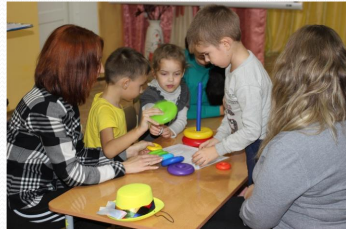
Детско-родительское мероприятие «Путешествие в страну Математики»