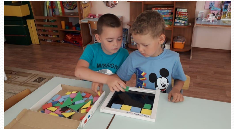
Работа в парах «Занимательные геометрические фигуры»

Педагоги дошкольных учреждений Нижнеломовского района, дети дошкольного возраста от 2 -7 лет, родители воспитанников