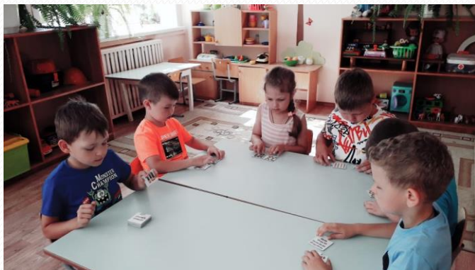
Совместная игровая деятельность «Математическое лото»