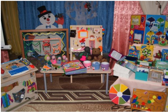
Выставка оборудования для работы с детьми по формированию элементарных математических представлений