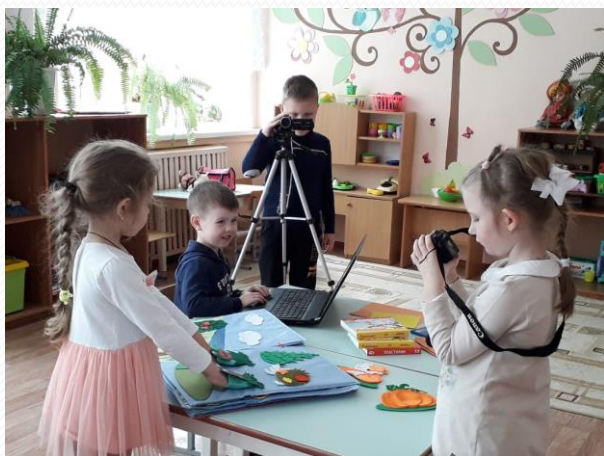
Мультстудия «Светлячок» – создаем мультфильм по математике «Сказка про краски»