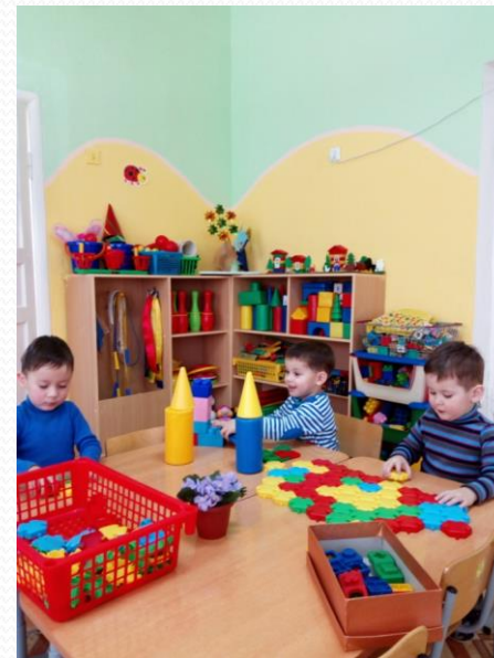
Проблемная ситуация «Волшебный город Математики»