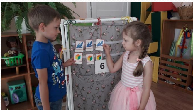
Работа в парах «Состав числа»