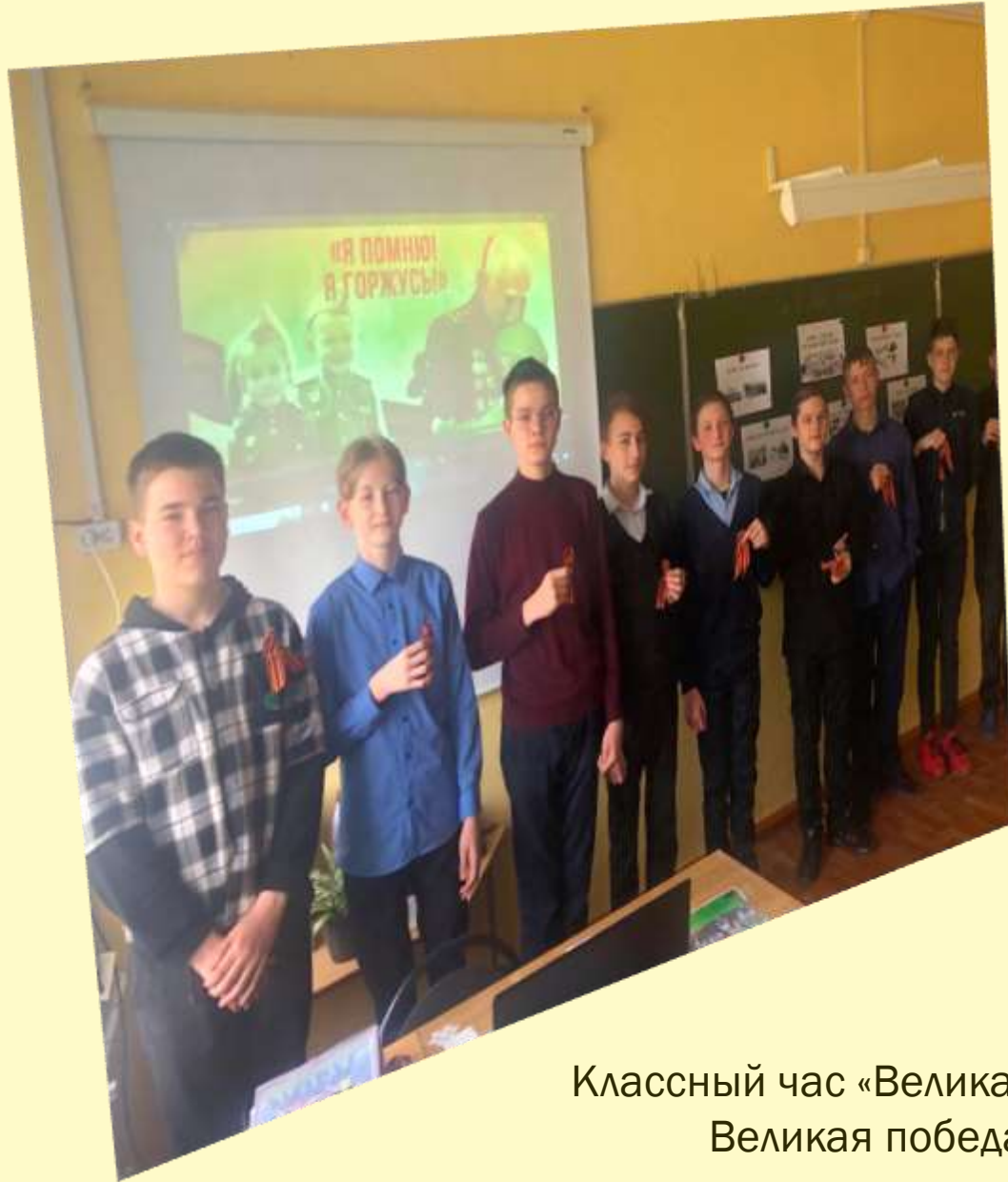
Классный час «Великая война- Великая победа»