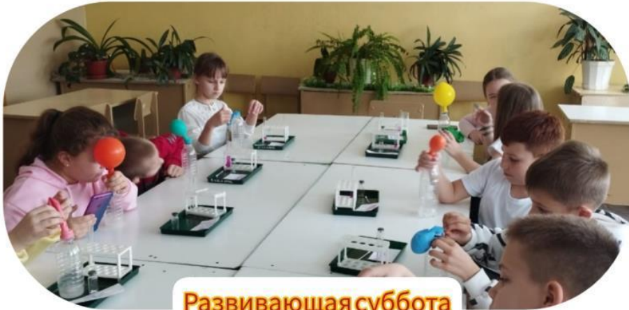
Развивающая суббота в Точке роста